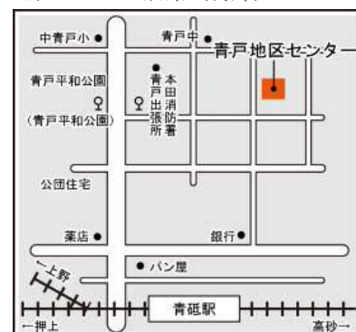
青戸地区センター（葛飾区青戸 5-20-6）

以下の上映会は「わがまち楽習会」ではありませんが、第4回「子どもの権利条例」と子ども夢パークをより楽しくするために3つのネットワークで企画しました。ぜひ上映会&講座にご参加ください。